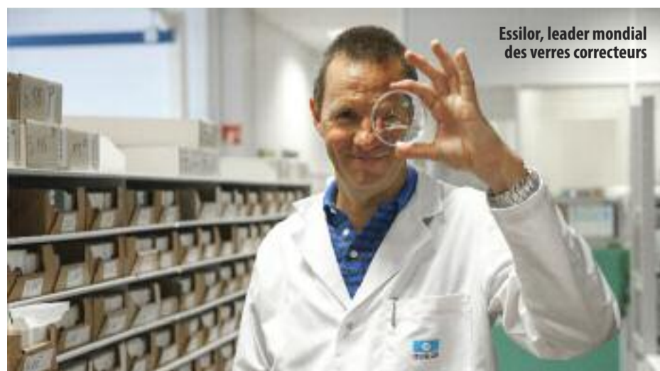
Essilor, leader mondial des verres correcteurs